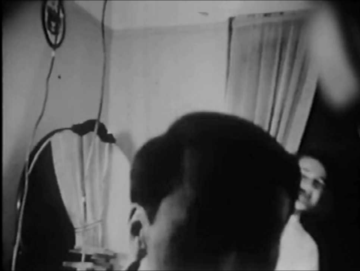
Lost, Lost, Lost (1976) Jonas Mekas (Fragmento inicial)